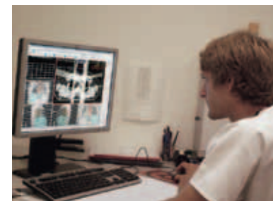
Bestrahlungsplanung am Computer.