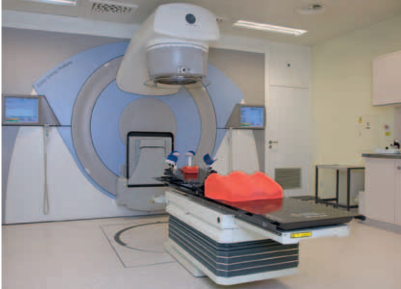
Bestrahlungsgerät (Linearbeschleuniger) mit Bestrahlungstisch und Lagerungshilfen (rot).

Bestrahlungen mit Elektronen eignen sich in erster Linie zur Behandlung oberflächlich gelegener Tumoren (z. B. der Haut) und von Narben oder Entzündungen, da ihre Eindringtiefe relativ gering ist.