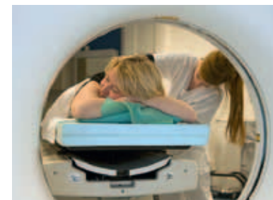
Für das Planungs-CT wird die Patientin vor dem Computertomographen exakt gelagert.

Vor der ersten Bestrahlung wird das Vorgehen simuliert, das heißt, die Bestrahlung wird vorerst nur nachgeahmt. Dabei wird die Genauigkeit der Planung kontrolliert. Präzision ist oberstes Gebot, denn die Strahlen sollen das bei der Planung bezeichnete Zielvolumen millimetergenau treffen und gesundes Gewebe optimal verschonen.