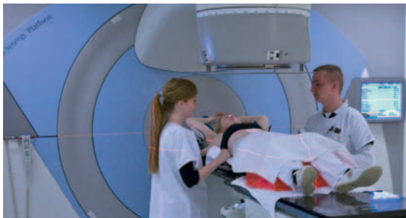
Exakte Lagerung am Bestrahlungsgerät (Linearbeschleuniger).

Als Lagerungshilfen bezeichnet man Tischauflagen, die auf die individuellen Bedürfnisse des Patienten oder der Patientin eingestellt werden und mit deren Hilfe täglich die genaue Position erreicht werden kann (z.B. Mamma-board bei Brustbestrahlungen, Lochbrett/Bellyboard bei Bestrahlungen im Bauchraum).