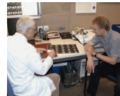
Radioonkologe und Patient besprechen die geplante Strahlentherapie anhand von diagnostischen Befunden.

Bei Ihrem ersten Besuch in der radioonkologischen Klinik werden Sie daher mit dem Vorgehen vertraut gemacht. Sie können sich dazu ohne Weiteres von einer Person Ihres Vertrauens begleiten lassen.